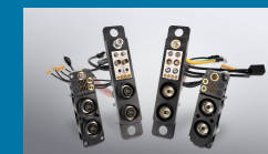
ODU-MAC® Power Connector