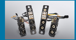
ODU-MAC® Power Connector