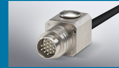
ODU DOCK Silver-Line