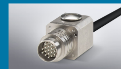
ODU DOCK Silver-Line