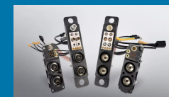
ODU-MAC® Power Connector